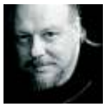
Lutz Schelhorn , geboren 1959 in Stuttgart, baute bis vor einigen Jahren Motorräder. Heute widmet sich der Fotograf am liebsten freien Arbeiten: besonders Porträts.

Die Kunststiftung Baden-Württemberg zeigt nun im Rahmen des Fotosommers eine Auswahl der Schelhorn'schen Bahnhofsbilder in ihrem Haus in der Stuttgarter Gerokstraße 37. Am nächsten Donnerstag wird dort die Ausstellung um 19.30 Uhr mit einer Vernissage eröffnet. Bei dieser Gelegenheit soll auch der aufwendig gestaltete Katalog vorgestellt werden, der nicht nur die Schwarz-Weiß-Fotos des Stuttgarter Fotografen enthält, sondern auch Beiträge prominenter Stuttgarter zum Bonatz-Bau und zum Bauprojekt Stuttgart 21 – manche pro, manche contra. th