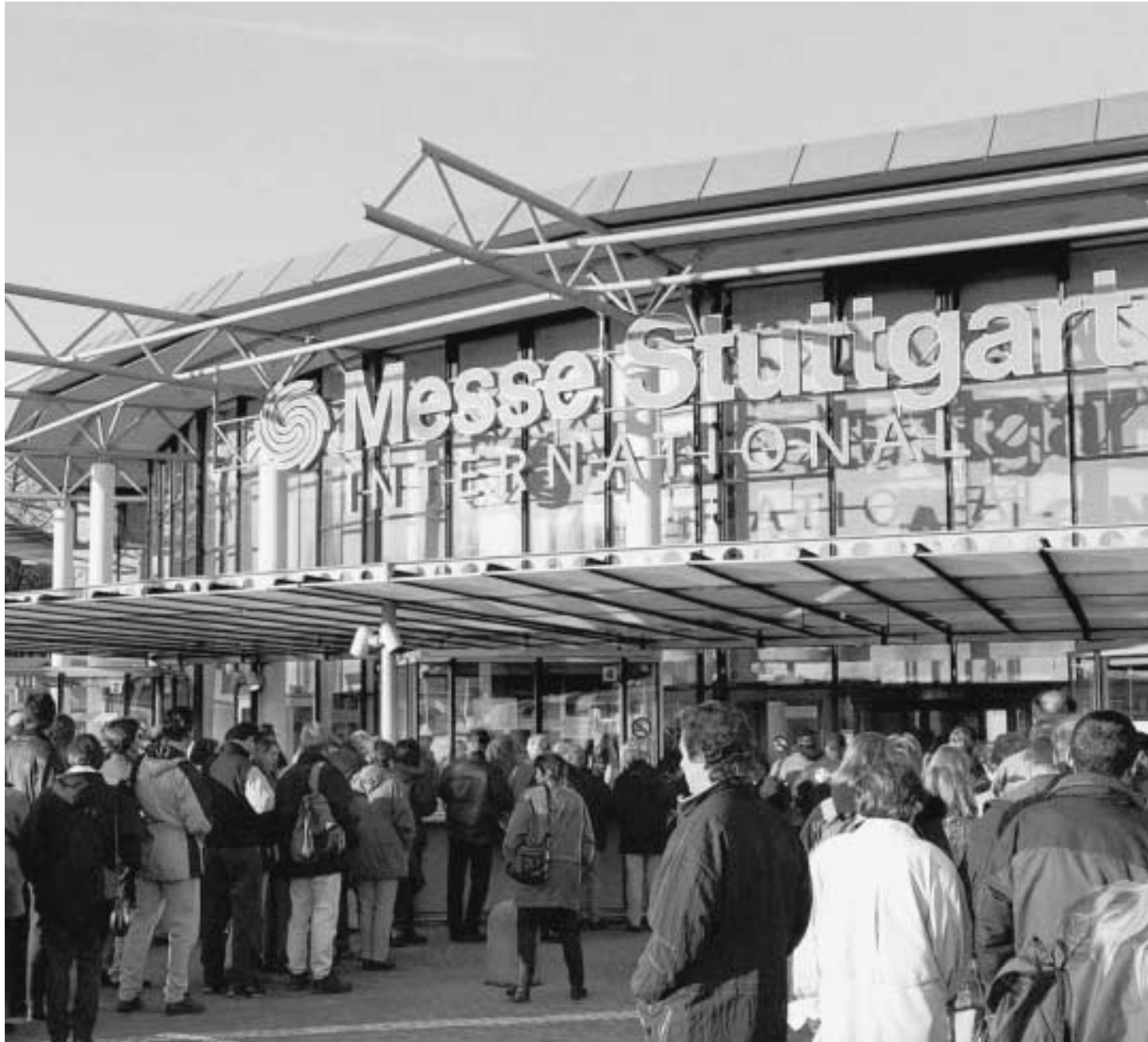
Die Messe Killesberg ist 1987 mit 25 Millionen Euro Zuschuss ausgebaut worden. Davon will das Land nichts zurück.