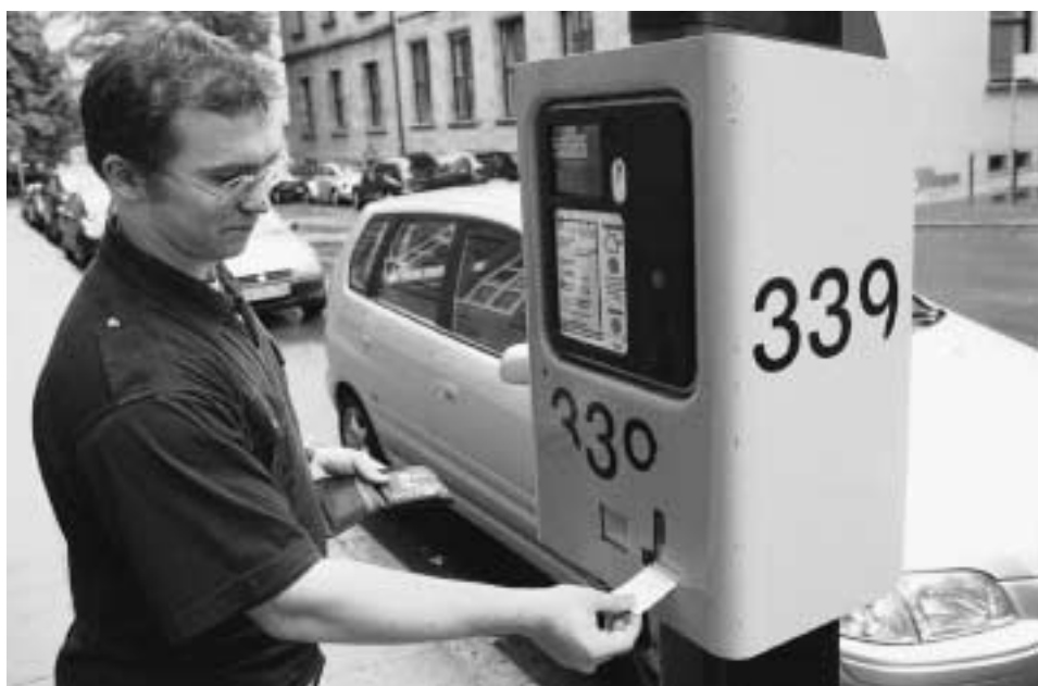
Diesen Automaten in der Schellingstraße hat der unbekannte Profi manipuliert.

Aufgefallen war die Manipulation am Donnerstag nämlich nur, weil ein Mitarbeiter der Stadt die Automaten warten wollte und dazu aufschließen musste. Für die wöchentli-