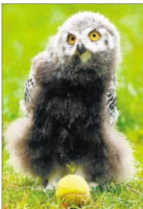
Steht auf einen Tennisball

Es gäbe noch so manch delikates Detail über den Pfau, der auf eine Tanksäule stand, zu verzapfen. Vermutlich, meinte seine Besitzerin, habe ihn das Gurgeln der Benzinpumpe an das Geräusch einer paarungsbereiten Pfauenbraut erinnert.