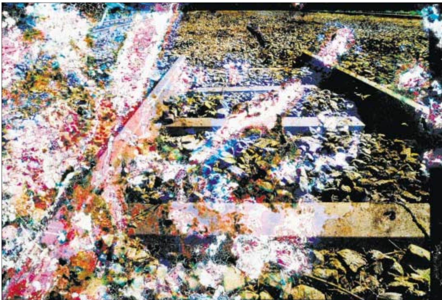
Totes Gleis am Nordbahnhof: Die Dia-Vorlage für dieses Bild lag drei Wochen in der Erde